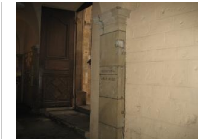
Vue du site - Auteur : CACG