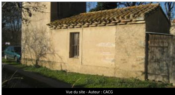
Vue du site - Auteur : CACG