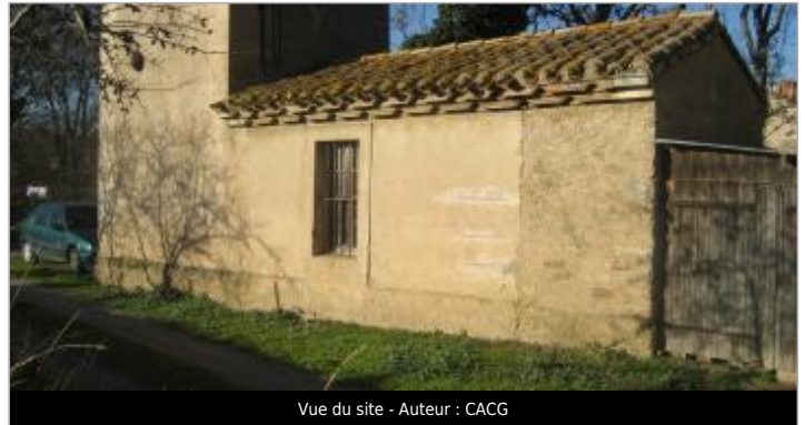
Vue du site - Auteur : CACG

Coordonnées WGS84 : X: 2.62504928 / Y: 43.22169950