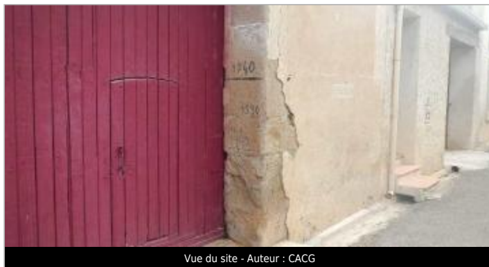
Vue du site - Auteur : CACG