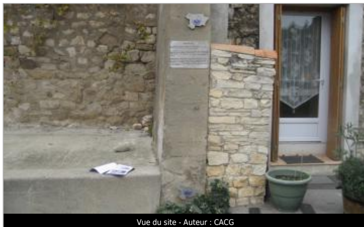
Vue du site - Auteur : CACG