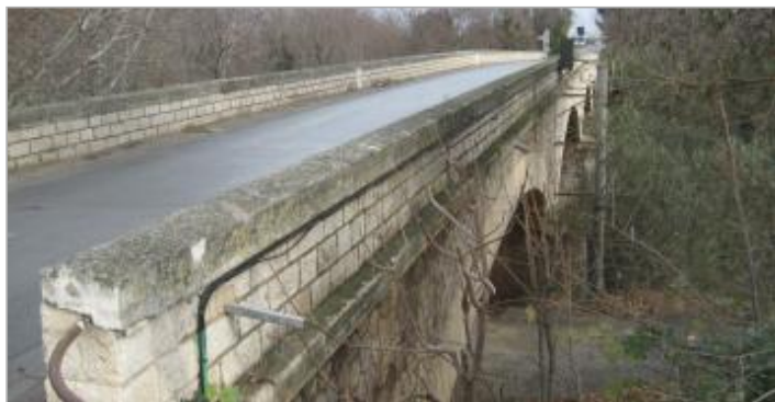
Vue du site - Auteur : CACG