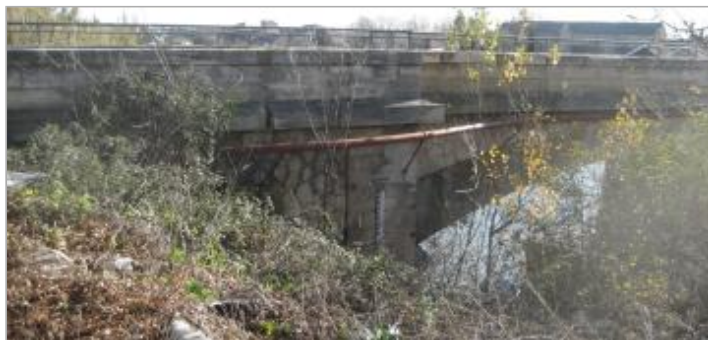
Vue du site - Auteur : CACG