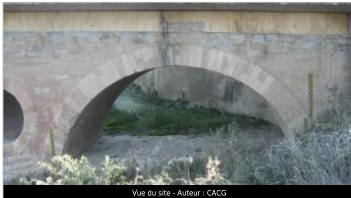
Vue du site - Auteur : CACG