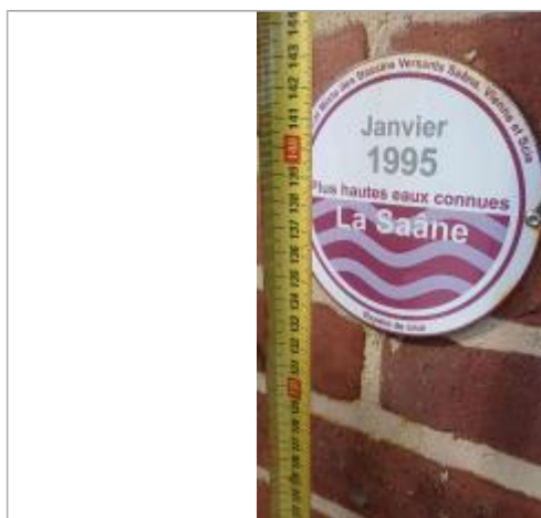
Macaron à 138,5 cm/sol