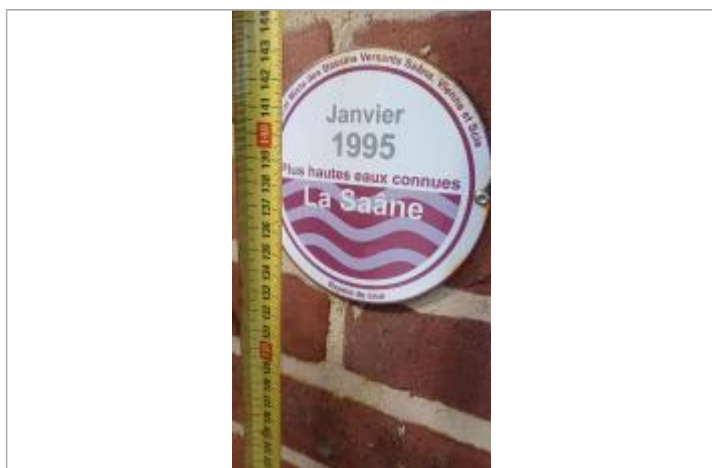
Macaron à 138,5 cm/sol

Altitude calculée de l'eau (en m) : 6.25 m