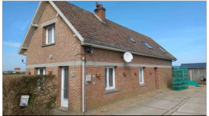
Mur de briques de la façade de la maison du Pêcheur. Rue de la Saône. Route Départementale n° 127.