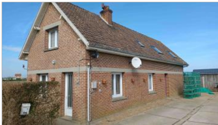
Mur de briques de la façade de la maison du Pêcheur. Rue de la Saône. Route Départementale n° 127.

Coordonnées WGS84 : X: 0.92739340 / Y: 49.90301200