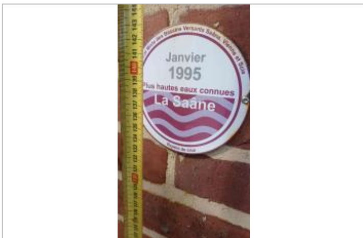
Macaron à 138,5 cm/sol

Altitude calculée de l'eau (en m) : 6.25 m