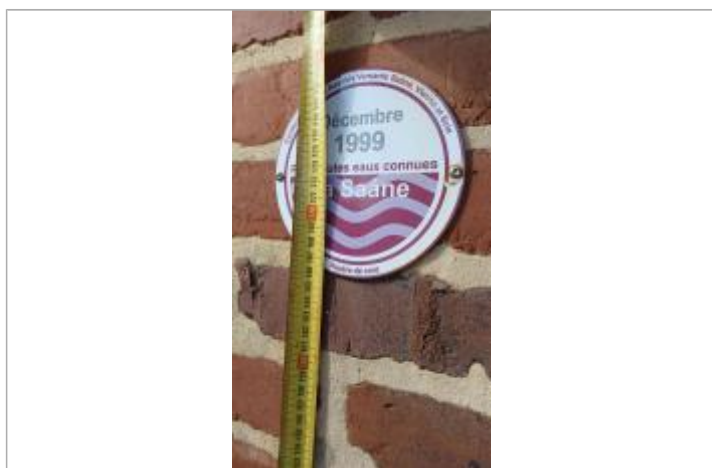
Macaron à 172,5 cm/sol

Altitude calculée de l'eau (en m) : 6.6 m