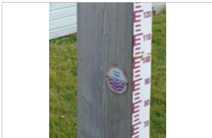
Macaron à 88 cm/échelle limnimétrique du totem.