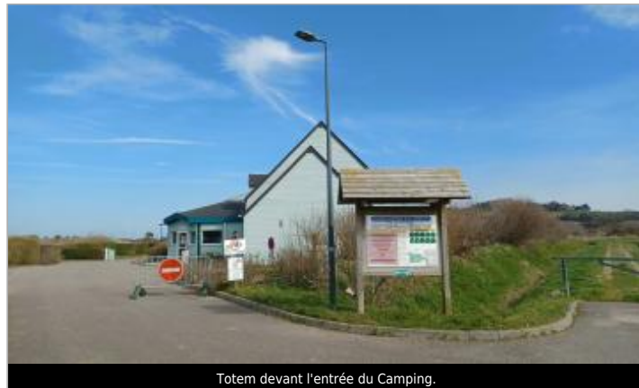
Totem devant l'entrée du Camping.

Coordonnées WGS84 : X: 0.92688640 / Y: 49.90471000