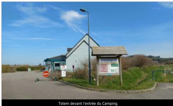
Totem devant l'entrée du Camping.