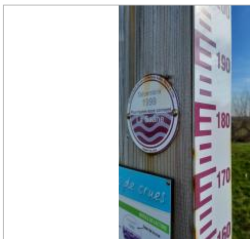
Macaron à 179 cm/échelle limnimétrique du totem.