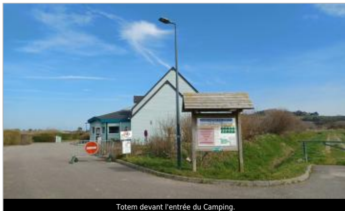
Totem devant l'entrée du Camping.

Coordonnées WGS84 : X: 0.92688640 / Y: 49.90471000