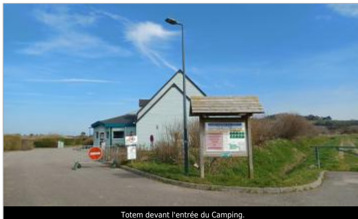
Totem devant l'entrée du Camping.