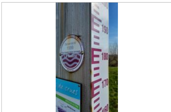
Macaron à 179 cm/échelle limnimétrique du totem.