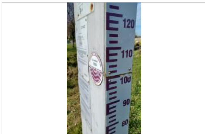
Macaron à 101 Cm/échelle limnimétrique.