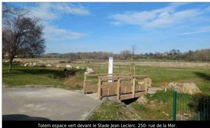
Totem espace vert devant le Stade Jean Leclerc. 250- rue de la Mer.