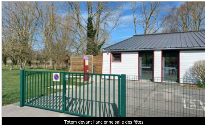
Totem devant l'ancienne salle des fêtes.