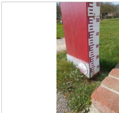
Macaron à 6 Cm/échelle limnimétrique du totem