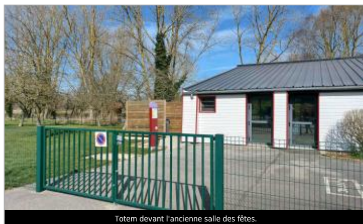
Totem devant l'ancienne salle des fêtes.