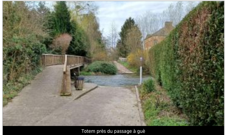
Totem près du passage à gué