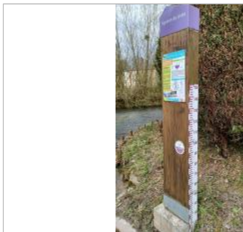
Cours d'eau : Saône. Macaron PHEC indiquant le niveau de la crue de décembre 1999 à 93 cm/ échelle limnimétrique.

Altitude calculée de l'eau (en m) : 61 m