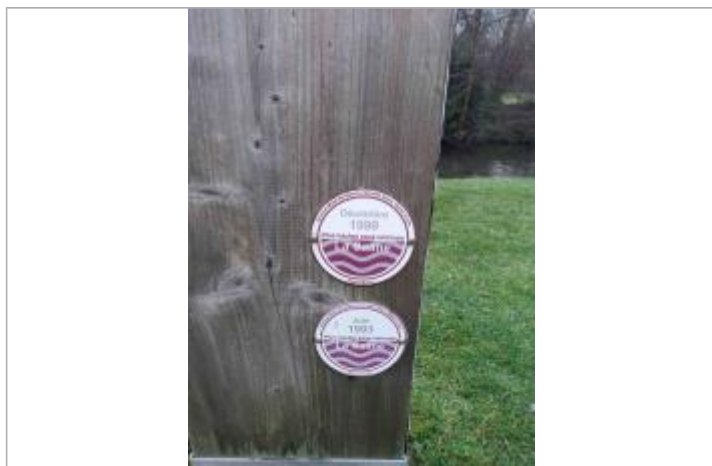
Vue sur la marque, à la base du totem