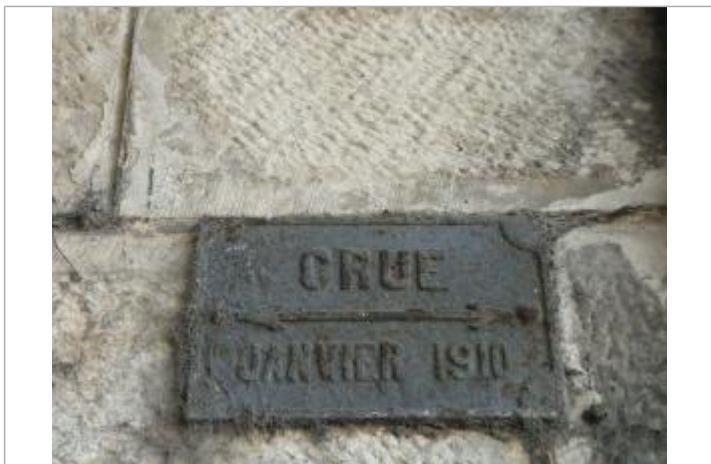
PILIER SNCF RUE DU 8 MAI 45

GÉNÉRAL Code : DIREN_IDF_R_866_1310 Date de mise à jour : 19/11/2018 Auteur : SPC SMYL