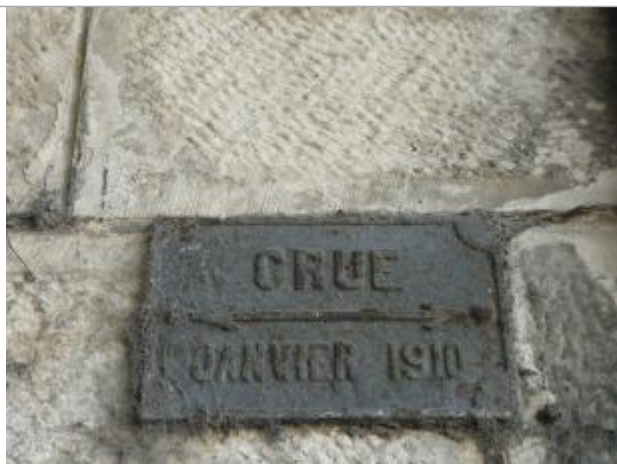
PILIER SNCF RUE DU 8 MAI 45

Système altimétrique : NGF IGN 1969 (système normal)