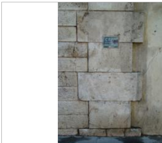
Repère de crue \"Crue janvier 1910\". 50, boulevard de Bercy. Paris, 12e.

Coordonnées WGS84 : X: 2.38297900 / Y: 48.83982400