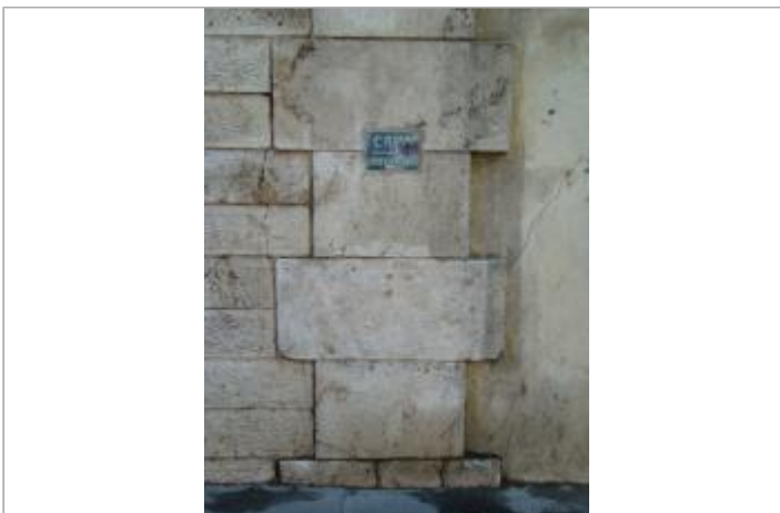
Repère de crue \"Crue janvier 1910\", 50, boulevard de Bercy. Paris, 12e.

GÉOLOCALISATION Coordonnées WGS84 : X: 2.38297900 / Y: 48.83982400 Coordonnées RGF93 (Lambert 93) X: 654712.74 / Y: 6860151.84 Coordonnées RGF93 (ETRS89) : X: 2.382979 / Y: 48.839824 Code Hydro: ----0010 Rive de référence: Droite