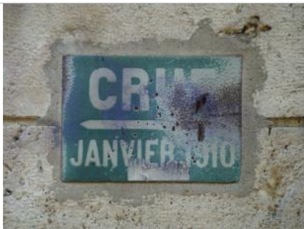
Repère de crue \"Crue janvier 1910\". 50, boulevard de Bercy. Paris, 12e.

Système altimétrique : NGF IGN 1969 (système normal)