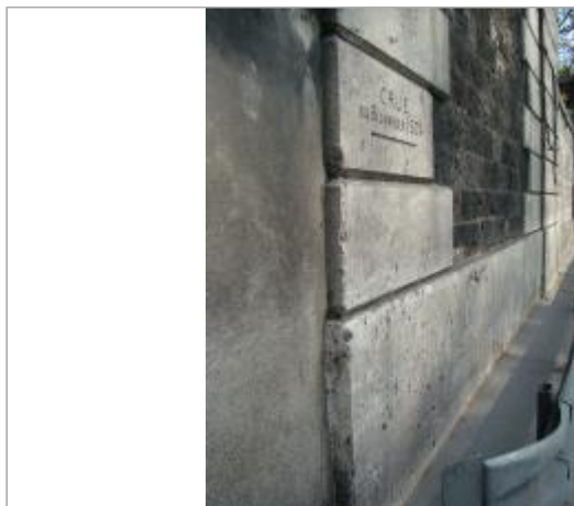
Repères de crue \"Crue du 6 janvier 1924\". Gare frigorifique de Paris-Bercy. Quai de Bercy, Paris 12e.