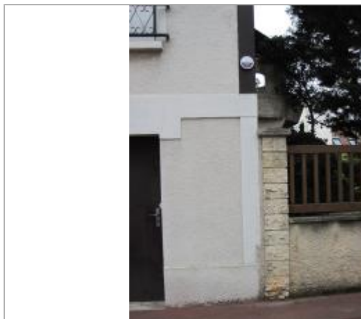
Repère n° 15 Pavillon 21 Bd des Bagaudes

Coordonnées WGS84 : X: 2.46542522 / Y: 48.80987860