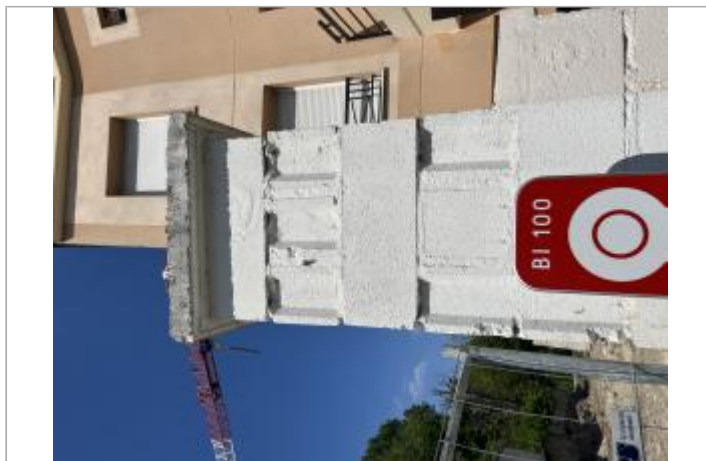
Repère 1910 disparu