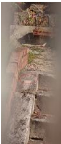
Plaque 1910 sur rampant/limon escalier vue à travail la grille (dans ellipse orangée)