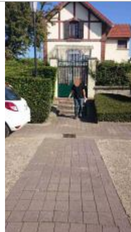
Maison face au barrage de Joinville (n°85) le 03/10/2014