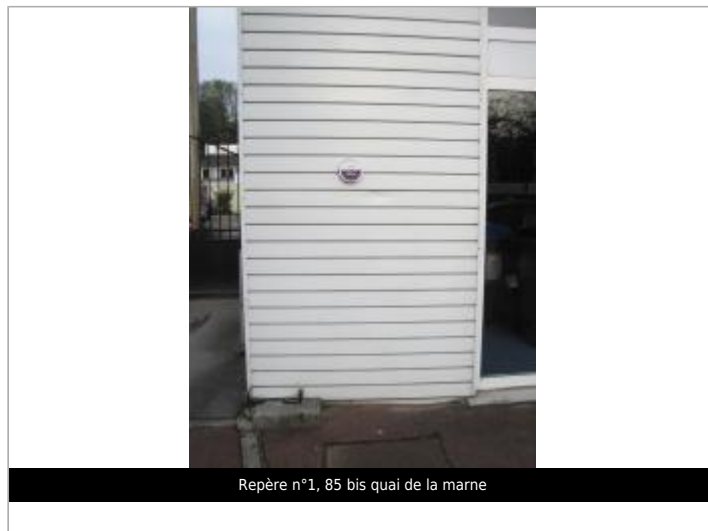
Repère n°1, 85 bis quai de la marne