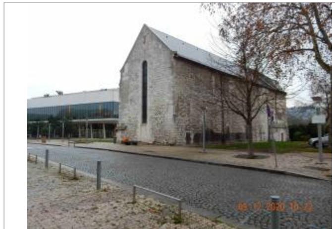
Chapelle Sainte Catherine