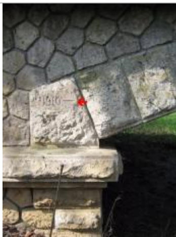
Repère de crue de 1910