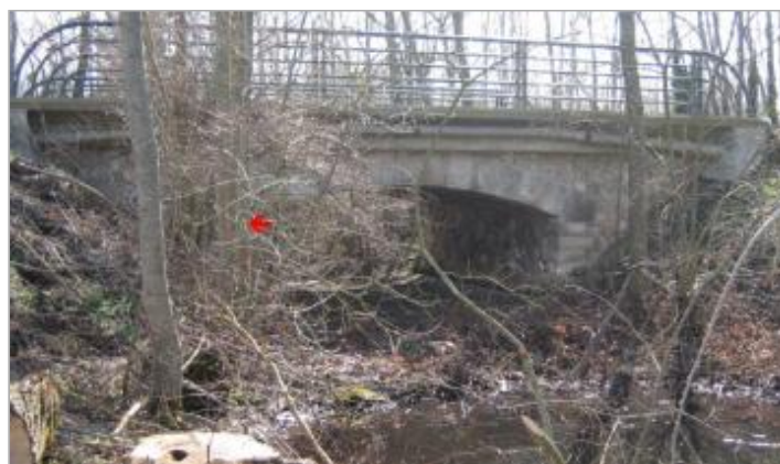
Ouvrage de décharge