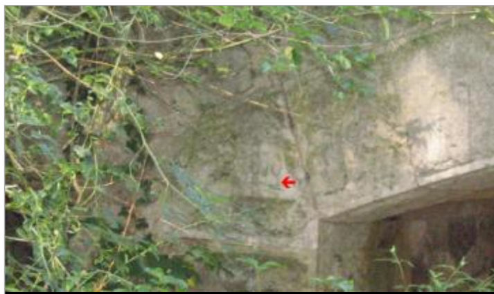
Culée du pont (ouvrage de décharge)