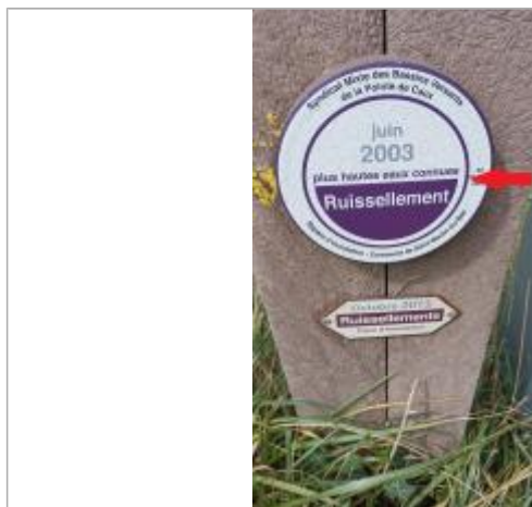
Crue du 1er juin 2003