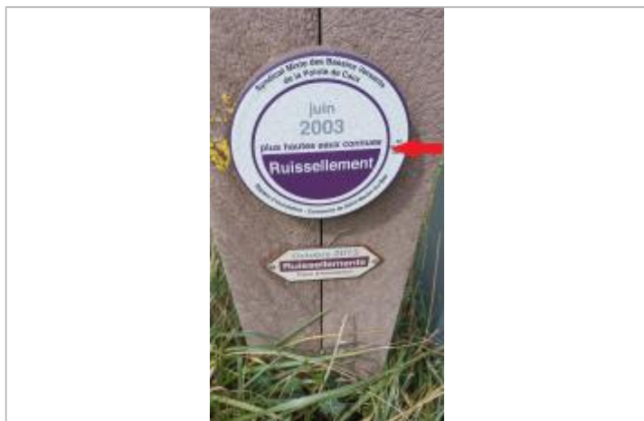
Crue du 1er juin 2003