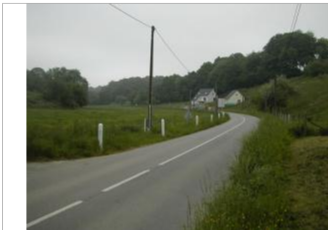
Macaron PHEC indiquant le niveau du ruissellement la 1er Juin 2003 à Saint-Martin-du-Bec

Coordonnées WGS84 : X: 0.20642280 / Y: 49.60193600