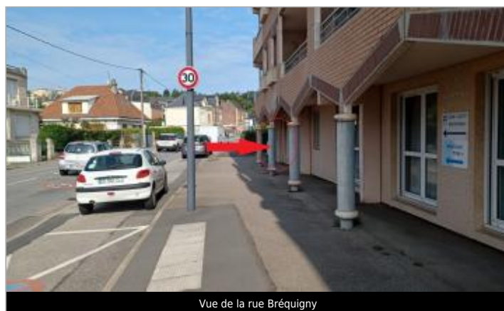
Vue de la rue Bréquigny

GÉOLOCALISATION Coordonnées WGS84 : X: 0.19386340 / Y: 49.54748180 Coordonnées RGF93 (Lambert 93) X: 496877.03 / Y: 6942298.38 Coordonnées RGF93 (ETRS89) : X: 0.1938634 / Y: 49.5474818 Code Hydro: H73-0400 Rive de référence: Droite