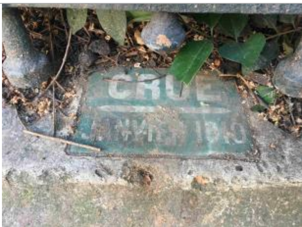
Vue du repère (posé à plat)

Système altimétrique : NGF IGN 1969 (système normal)