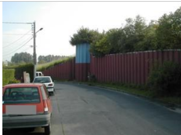
Macaron PHEC indiquant le niveau de la crue de La Lézarde du 1er juin 2003 à Harfleur .