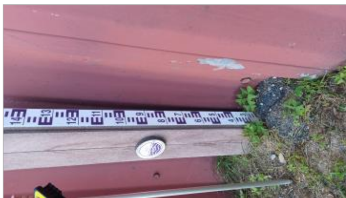
Macaron normalisé de la crue du 1 juin 2003