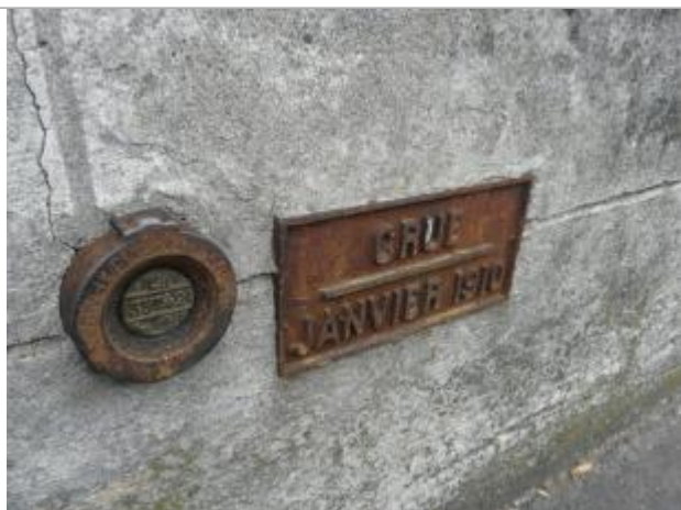
Plaque métallique indiquant le niveau de de la crue de 1910 à Villeneuve-Saint-Georges .

Système altimétrique : NGF IGN 1969 (système normal)