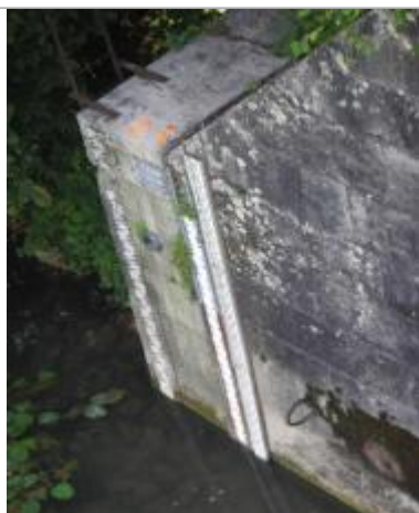
Repère de crue de 1910

Méthode : Non renseigné Organisme : DIREN Île-de-France Référence nivelée : Marque d'inondation Système altimétrique : NGF IGN 1969 (système normal) Altitude de la référence (en m) : 62.653 m Altitude calculée de l'eau (en m) : 62.653 m