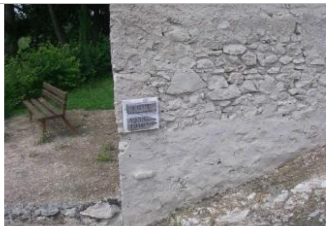
Repères de crue de 1910 et 1955

Altitude calculée de l'eau (en m) : 59.353 m