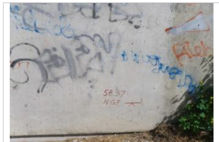
Repère de crue de 1910 ?

GÉNÉRAL Code : DIREN_IDF_R_467_658 Date de mise à jour : 24/07/2025 Auteur : SPC SMYL