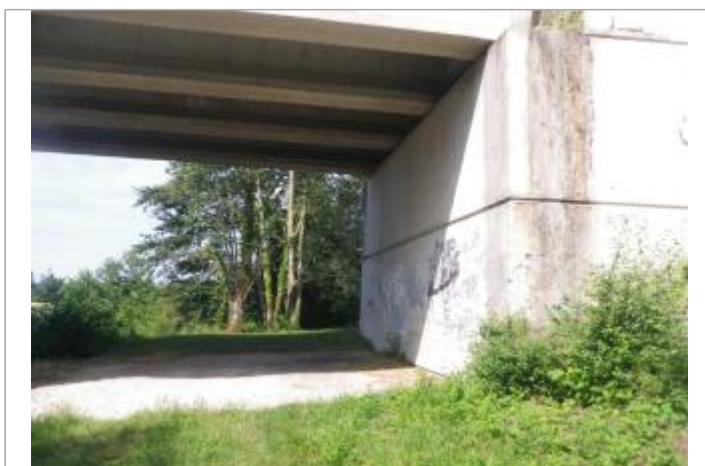
Le pont de Port Montain

GÉOLOCALISATION Coordonnées WGS84 : X: 3.33891030 / Y: 48.45895670 Coordonnées RGF93 (Lambert 93) X: 725056.78 / Y: 6817685.66 Coordonnées RGF93 (ETRS89) : X: 3.3389103 / Y: 48.4589567 Code Hydro: ----0010 Rive de référence: Droite