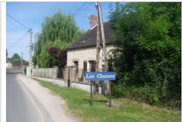
7 rue du Vieux Moulin