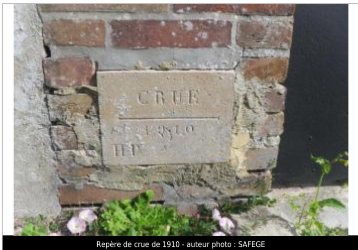
Repère de crue de 1910

Maximum de l'inondation : Oui Visibilité : Non renseigné État du repère : Bon Pérennité : Longue Repère calculé : Non renseigné PHEC : Non renseigné