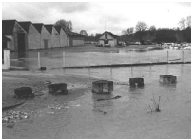
Le site lors de la crue du 27/04/1998

Altitude calculée de l'eau (en m) : 173.86 m