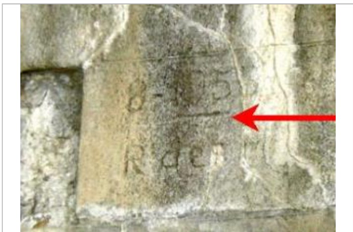
Repère de crue de 1955

GÉNÉRAL Code : DIREN_IDF_R_378_527 Date de mise à jour : 21/10/2019 Auteur : SPC SMYL