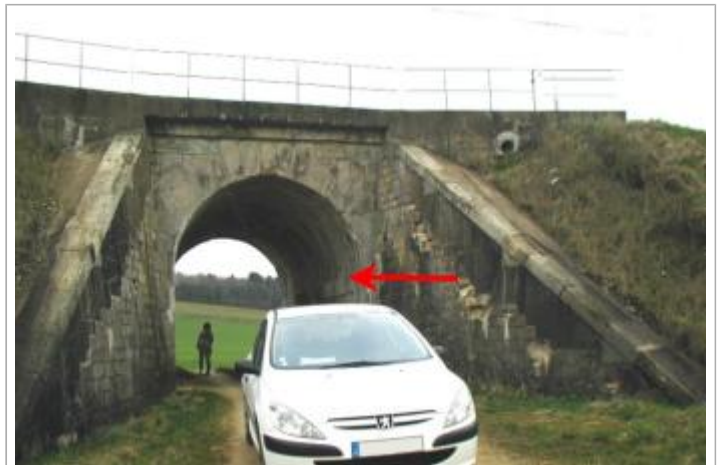
Pont SNCF

GÉOLOCALISATION Coordonnées WGS84 : X: 4.19609070 / Y: 47.73961200 Coordonnées RGF93 (Lambert 93) : X: 789638.78 / Y: 6738370.01 Coordonnées RGF93 (ETRS89) : X: 4.1960907 / Y: 47.739612 Code Hydro: F3--0210 Rive de référence: Gauche