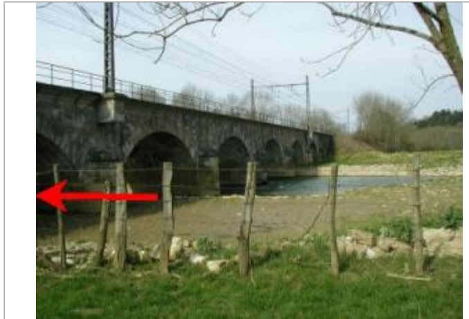
Pont SNCF sur l'Armançon - auteur photo : SOGREAH

Coordonnées WGS84 : X: 4.11958870 / Y: 47.76270260