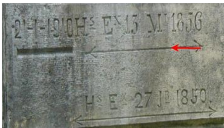
Repère de crue de 1856