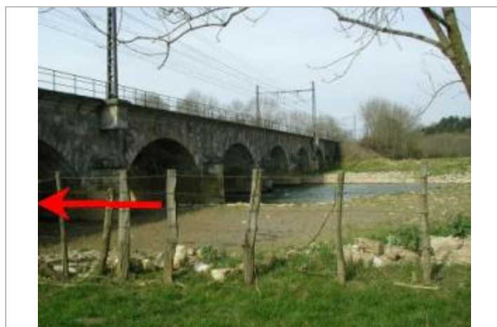
Pont SNCF sur l'Armançon

GÉOLOCALISATION Coordonnées WGS84 : X: 4.11958870 / Y: 47.76270260 Coordonnées RGF93 (Lambert 93) X: 783869.51 / Y: 6740851.19 Coordonnées RGF93 (ETRS89) : X: 4.1195887 / Y: 47.7627026 Code Hydro: F3-0210 Rive de référence: Gauche