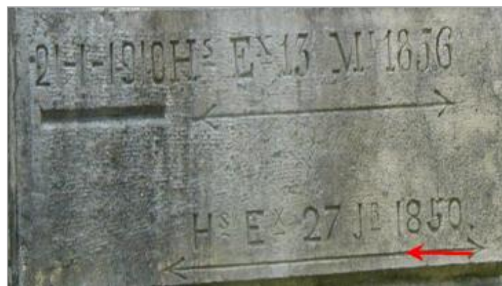
Repère de crue de 1850

GÉNÉRAL Code : DIREN_IDF_R_374_519 Date de mise à jour : 21/10/2019 Auteur : SPC SMYL