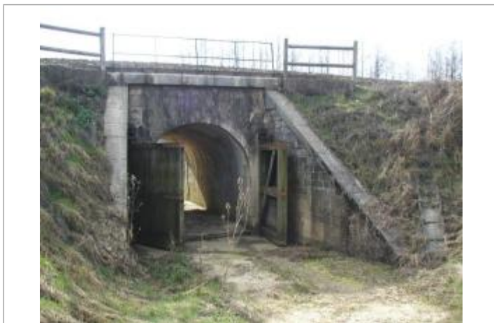
Pont SNCF