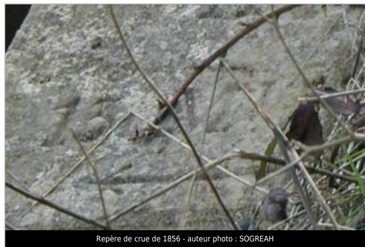
Repère de crue de 1856