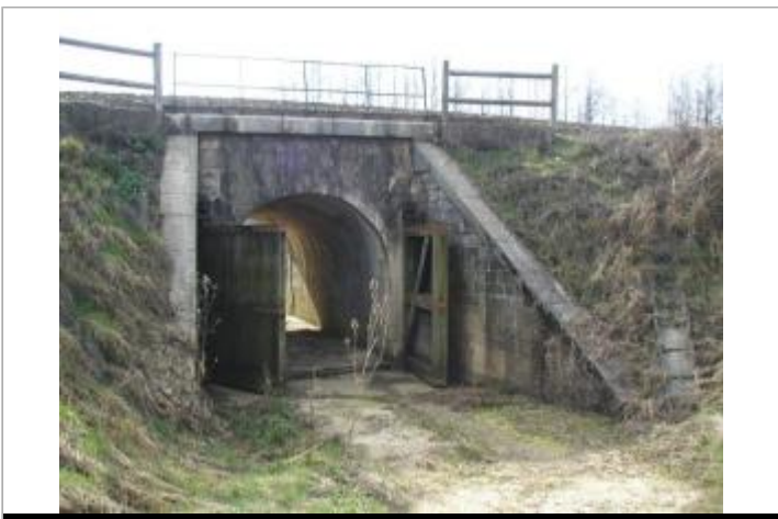
Pont SNCF

GÉOLOCALISATION Coordonnées WGS84 : X: 4.14178940 / Y: 47.76172710 Coordonnées RGF93 (Lambert 93) : X: 785534.04 / Y: 6740766.63 Coordonnées RGF93 (ETRS89) : X: 4.1417894 / Y: 47.7617271 Code Hydro: F3--0210 Rive de référence: Gauche