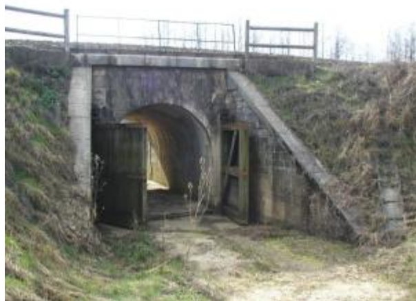
Pont SNCF