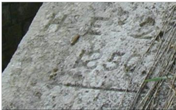
Repère de crue de 1850

Maximum de l'inondation : Oui Visibilité : Non renseigné État du repère : Bon Pérennité : Longue Repère calculé : Non renseigné PHEC : Non renseigné