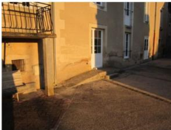
Capture Fiche IGN géodésie Z.B.03 - 164 (2014)