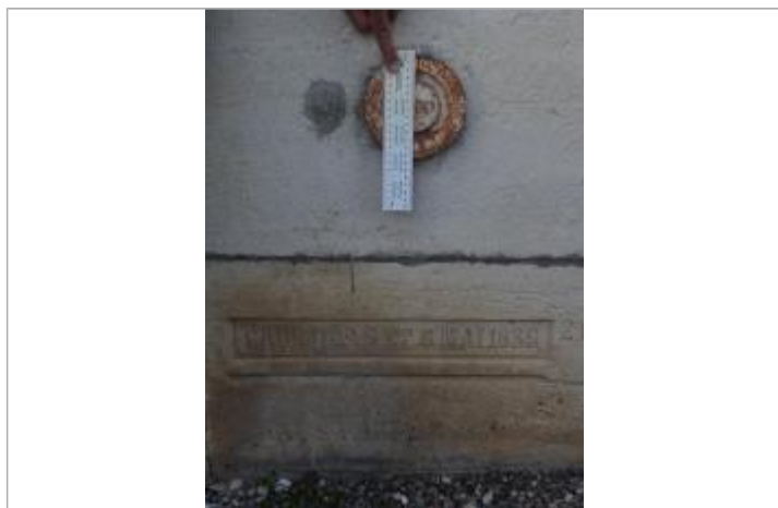
Détail des repères de crue et repère Y.C.M3 - 13 coin maison éclusière de la Chaînette

Altitude calculée de l'eau (en m) : 97.99 m