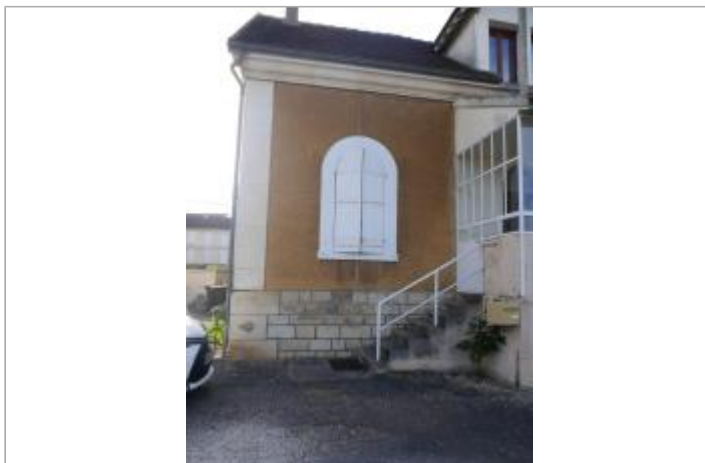
Maison éclusière de la Chaînette (13 juin 2017)