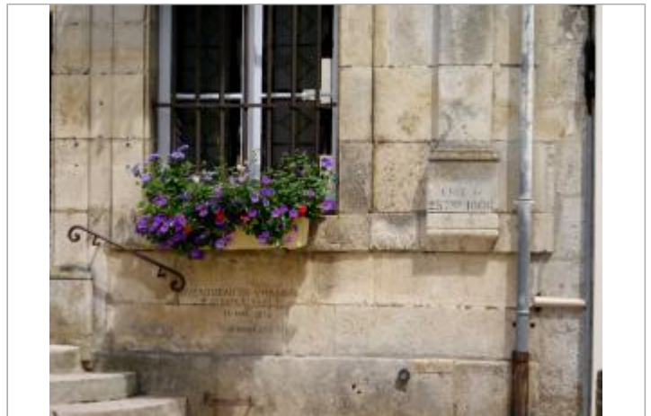
Hôtel de Ville de Noyers-sur-Serein

Coordonnées WGS84 : X: 3.99572700 / Y: 47.69563870