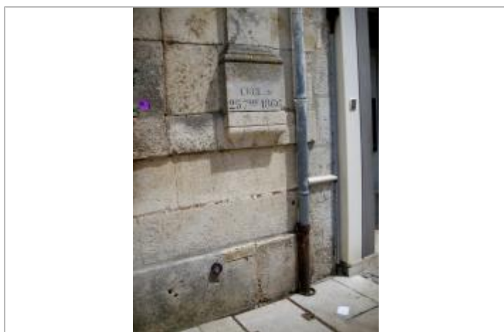
Repère de crue de 1866

Code : DIREN_IDF_R_161_236 Date de mise à jour : 17/04/2018 Auteur : SPC SMYL