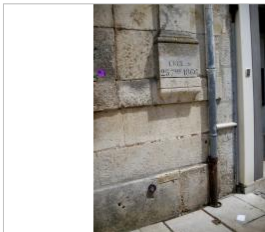
Repère de crue de 1866

Altitude calculée de l'eau (en m) : 175.684 m