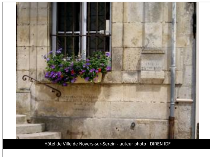
Hôtel de Ville de Noyers-sur-Serein