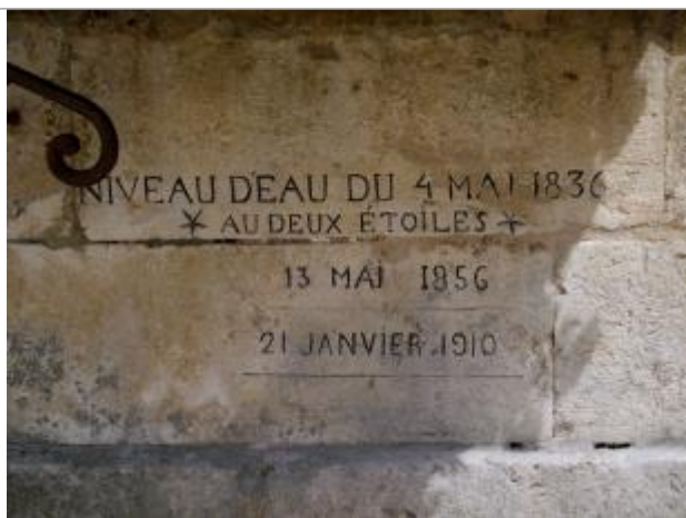
Repères de crue de 1910, 1856 et 1836

Altitude calculée de l'eau (en m) : 174.831 m