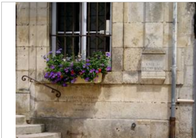
Hôtel de Ville de Noyers-sur-Serein

Coordonnées WGS84 : X: 3.99572700 / Y: 47.69563870