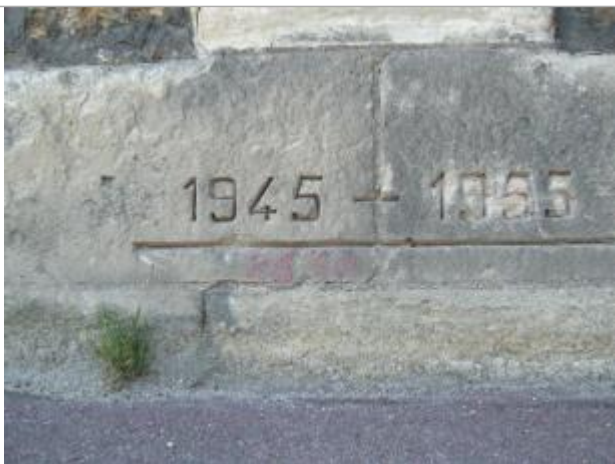
Repère de crue de 1945/1955

Système altimétrique : NGF IGN 1969 (système normal)